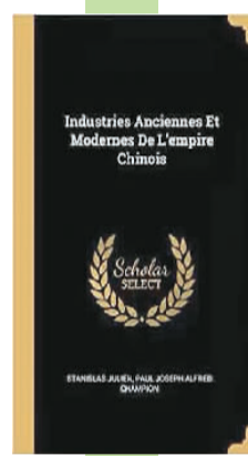
《天工开物》法文译本，法国汉学家儒莲译合集《中华帝国工业之今夕》，2018年再版本。