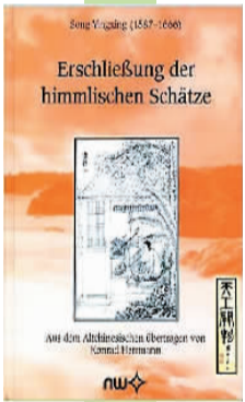
《天工开物》德文译本，关增建译，2004年自然科学出版社出版。

将《天工开物》译成现代日文，由东京恒星出版社出版。1969年，该版本由东京平凡社修订再版，列为“东洋文库丛书”之一。