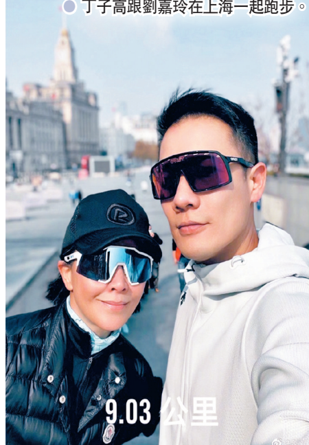
●丁子高跟劉嘉玲在上海一起跑步。