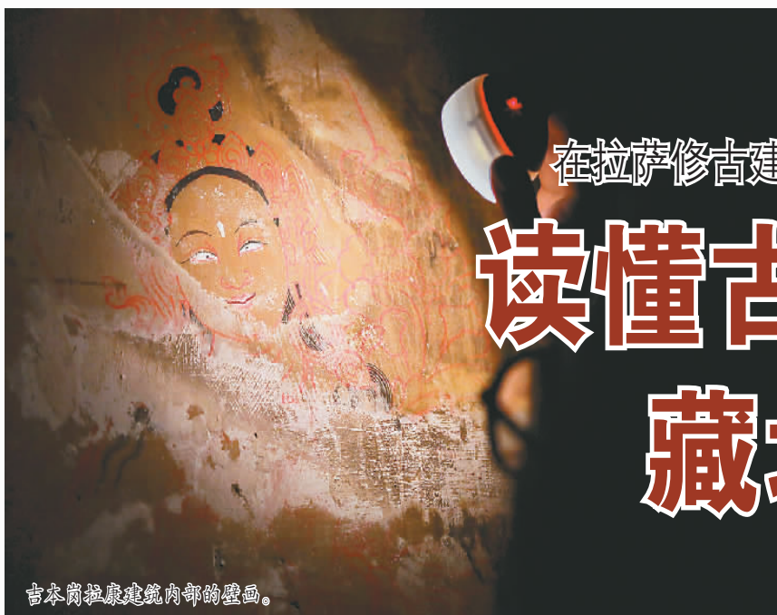
吉本岗拉康建筑内部的壁画。