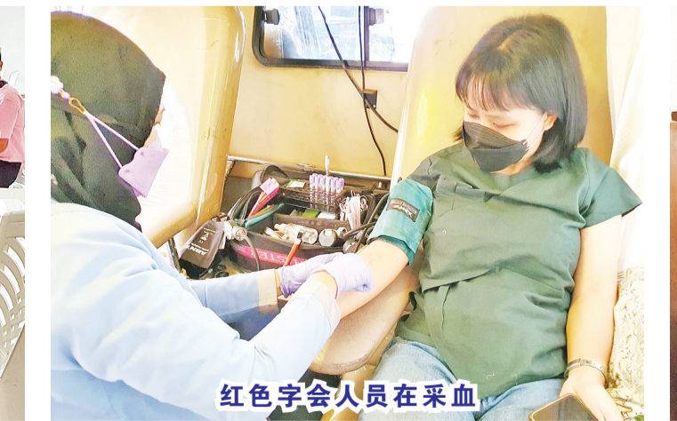
红十字会人员在采血