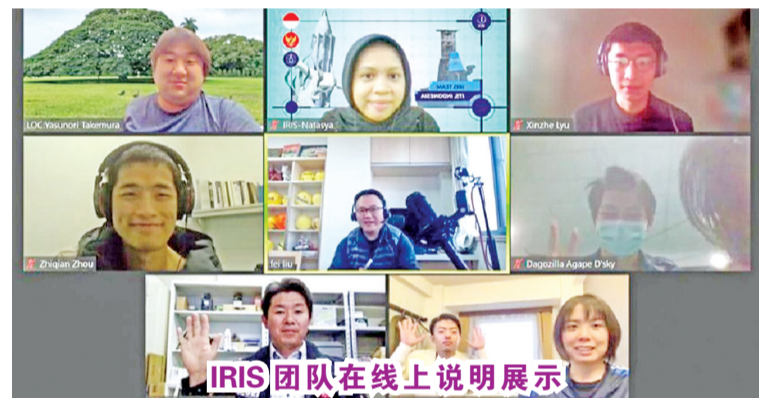
IRIS 团队在线上说明展示

为期五天的 2021 年 RoboCup Asia-Pacific 比赛中获得了视频挑战组第二名和科学挑战组第四名。