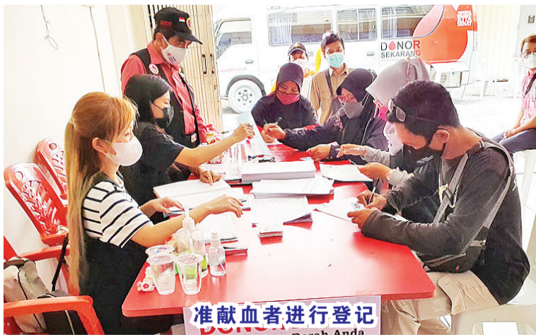
准献血者进行登记