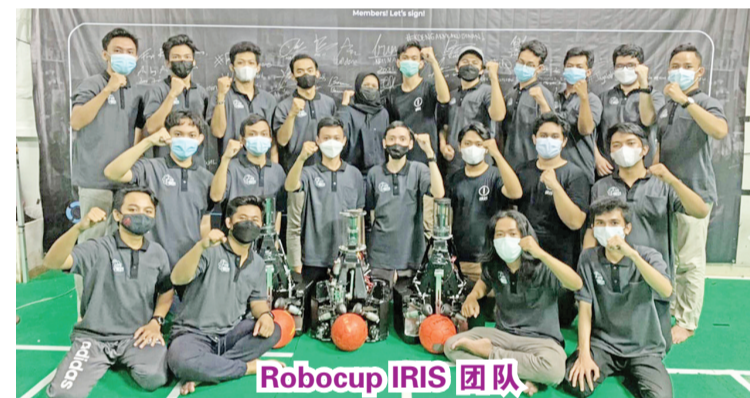
Robocup IRIS 团队