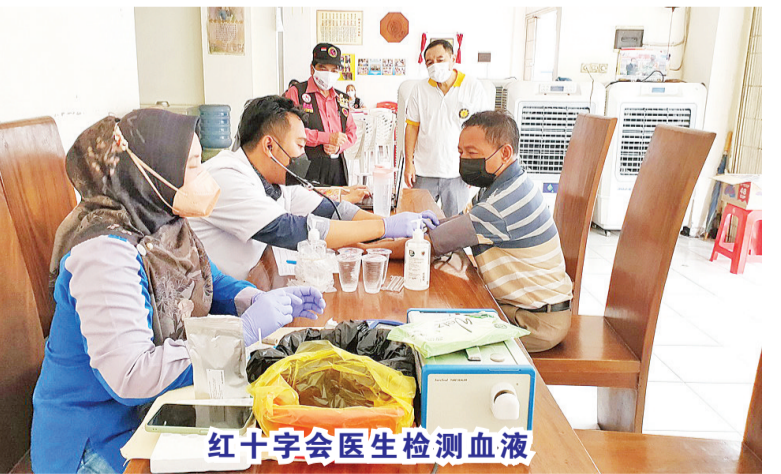
红十字会医生检测血液