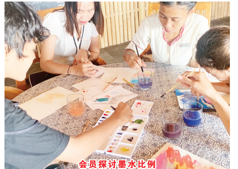
会员探讨墨水比例

【本报讯】12月5日至15日印尼水墨协会 (Indonesia Watercolor Sumit) 在巴厘岛吉安雅县 Komaneke 美术馆举行水墨画展览; 此非营利性的协会希望通过艺术和创业的结合, 不仅在推广水墨画的同时, 也能提高年轻艺术家经济上的收入。