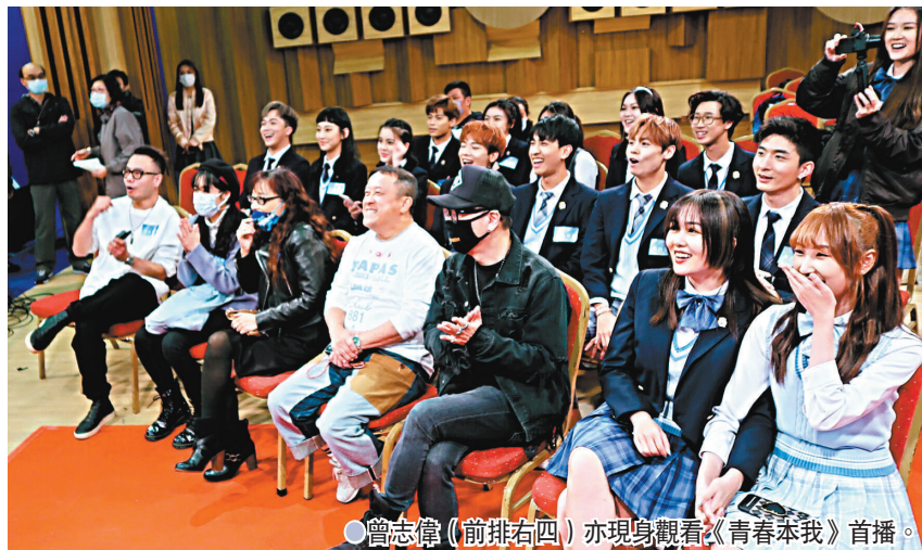
● 曾志偉(前排右四)亦現身觀看《青春本我》首播。