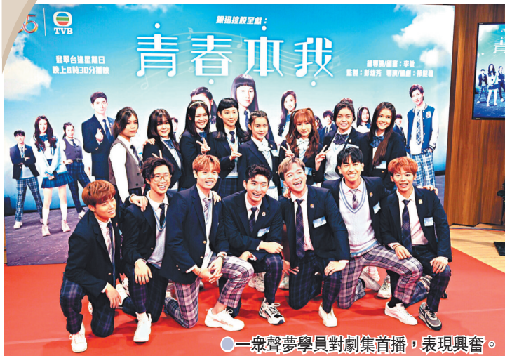
● 一聲聲夢學員對劇集首播，表現興奮。