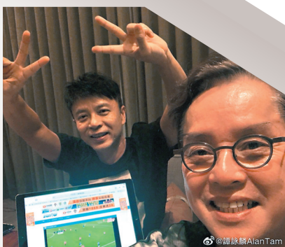
● 阿倫與克勤都是足球發燒友。