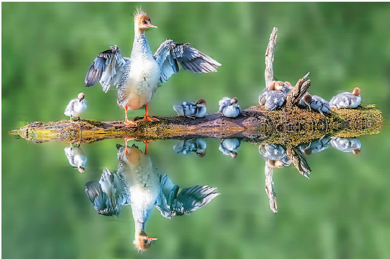
吉林省白山市抚松县漫江，中华秋沙鸭正在江面休憩。