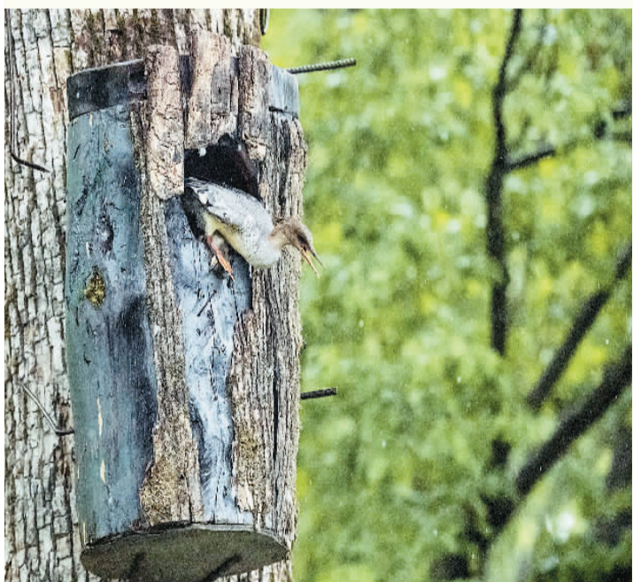
正在孵化的雌性中华秋沙鸭从人工鸟巢飞出来觅食。