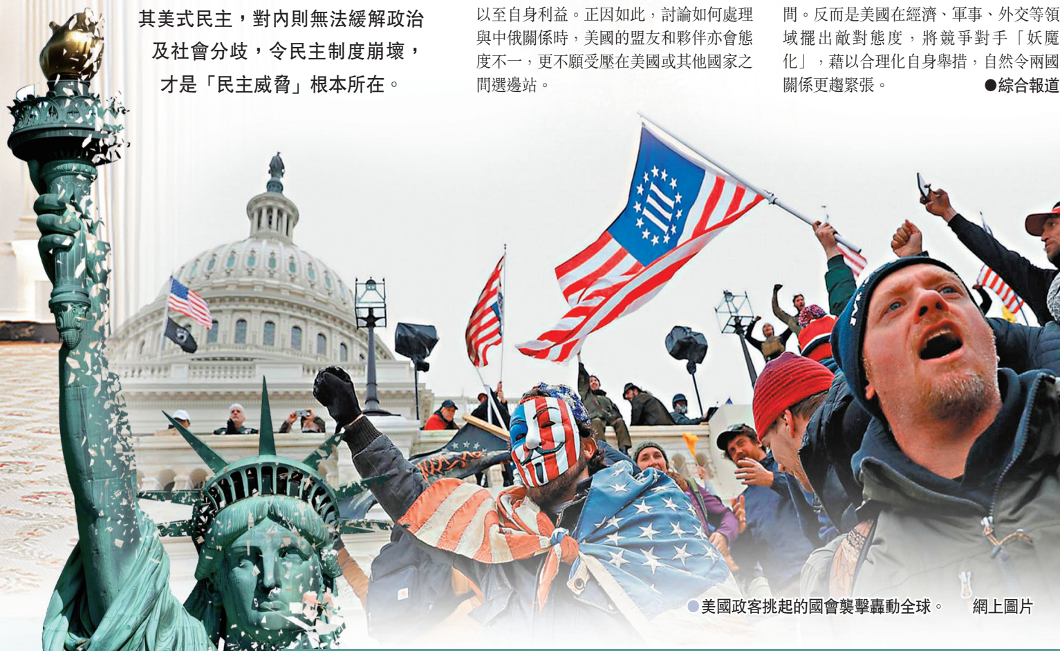
●美國政客挑起的國會襲擊轟動全球。