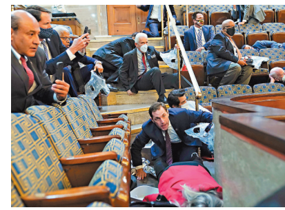
●國會暴動期間，議員躲在椅下。