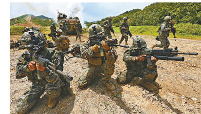
●美國加劇全球軍備競賽。圖為美韓聯合軍演。