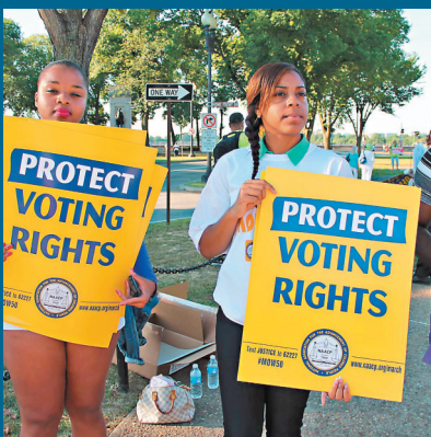
●美國有色人種投票權被削弱。