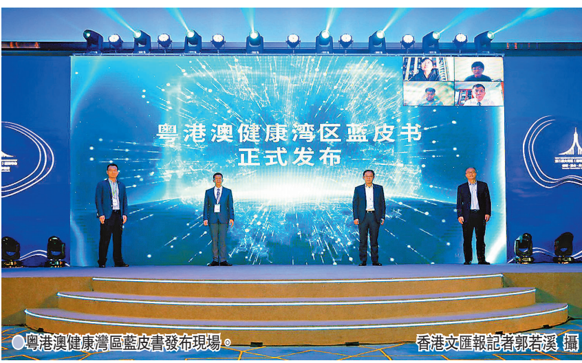
●粵港澳健康灣區藍皮書發布現場。

力，降低對國際疫苗的依賴；在批准上市環節，港澳地區可參考內地疫苗流通和接種點滲透的特點，優化自身接種體系；在應用環節，頻繁的人員交流，可推動灣區疫苗接種服務的趨同等。 疫苗借鑒藥械通在灣區先行先試 作為疾病防控的重要工具，創新疫苗可通過借鑒港澳藥械通等政策，探索其在大灣區內先行先試的可行路徑，從而推動構建集預防、醫療、康復、保健於一體的健康灣區。 而大灣區在疫苗管理和預防接種服務體系方面的創新突破，也將在全國範圍內啟動示範性作用，為國家改革疫苗管理體制提供大灣區樣本和先進經驗。