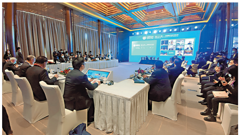
●從都國際論壇的「經濟社會發展與氣候變化：實現2030議程」分組討論現場。

對於後疫情時代的全球合作，多名參會嘉賓都認為，後疫情時代迫切需要加強全球合作，並高度評價中國對全球抗疫及經濟發展等方面所作的貢獻。聯合國秘書長古特雷斯在視頻致辭時表示，新冠肺炎疫情的肆虐，更加凸顯了全球合作在疫苗和國際交流方面的重要性。他認為應該建設更具包容性，相互連接，更為有效的多邊主義，促使人們能夠更普惠地享有醫療、教育和收入支持。