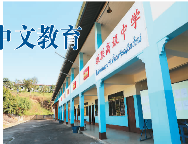
图为位于泰缅边境清道县的清迈教联高级中学

“我一直深爱着华文教学,尽心尽力地让每一位学生成为中华文化的继承者,更要做一个中华文化的传播