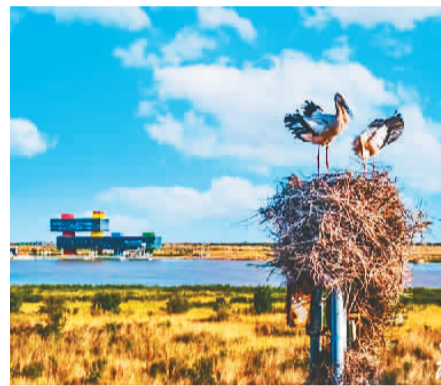
黄河三角洲是东方白鹳全球最大繁殖地、黑嘴鸥全球第二大繁殖地、白鹳全球第二大越冬地和栖息地。

黄河口国家公园划定范围35.23万公顷,其中陆域面积13.71万公顷,海域面积21.52万公顷,同时还划定国家公园核心保护区面积18.41万公顷,占总面积的52.26%。(孙婷婷)