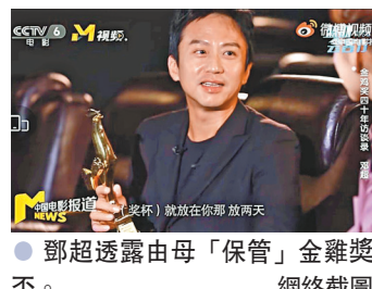
鄧超透露由母「保管」金雞獎盃。

綜合報道 金雞影帝鄧超近日在接受《中國電影報道》的「金雞40年影人訪談」系列欄目中向主持人透露,他在金雞獎奪獎後對媽媽說:「媽媽,你也辛苦了!(金雞獎盃)就放在你那,放兩天。」結果自己的獎盃就一直放在媽媽那裏,因他認為媽媽作為自己最好的鞭策者和鼓勵者,「保管」金雞獎盃十分有意義。