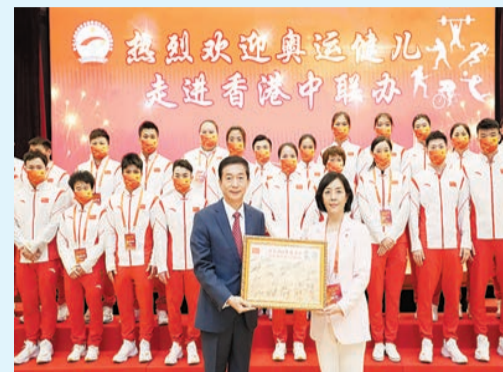
中聯辦主任駱惠寧(左)歡迎奧運健兒代表團到訪。

【香港商報訊】內地奧運健兒代表團昨日亦到訪中聯辦。中聯辦主任駱惠寧在歡迎致辭中表示，代表團克服疫情影響如期到訪香港，體現了中央對於香港市民特別是青年的關心。多年來，體育人以自己的出色拼搏，推動和見證國家強盛、民族復興的步伐。對奧運健兒們在東京賽場再揚國威致以敬意，對奧運健兒們在港為市民做精彩表演表示感謝。代表團團長、國家體育總局副局長楊寧致辭時表示，感謝香港社會各界人士長期以來對內地體育事業和兩地體育合作的關心支持。代表團此行是在講好中國奧運健兒為國增光的故事，展示新時代中國青年的青春力量，生動詮釋奧林匹克精神和中華體育精神。中聯辦副主任陳冬、秘書長王松苗，外交部駐港特派員公署特派員劉光源，駐港國安公署副署長孫青野，駐港部隊副政委王兆兵等昨日亦有出席活動。