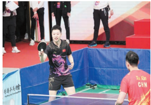
馬龍(左)和許昕在伊館表演，女粉絲全場沸騰。