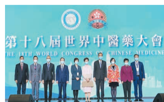
第18屆世界中醫藥大會一眾出席嘉賓合照。

【香港商報訊】記者馮仁樂報道：世界中醫藥學會聯合會主辦的「第18屆世界中醫藥大會」昨日在香港會議展覽中心舉行，大會以「中醫藥惠及人類健康 全球中醫藥機遇與挑戰」為主題，邀請逾30位來自世界各地的權威性醫學及中醫藥專家線上及線下參與研討。全國政協副主席梁振英、香港特區行政長官林鄭月娥、中聯辦副主任譚鐵牛、世界衛生組織前總幹事陳馮富珍等嘉賓出席。梁振英致辭表示，香港中醫藥根基深厚，在傳承的同時不乏創新，也是中藥材和中成藥的可靠市場。他認為，香港對中醫藥進一步發展的意義並不限於本地，更應成為推動中醫藥走向國際的「超級聯繫人」。期望業界把握大灣區機遇