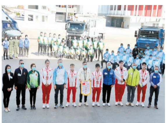
保安局局長鄧炳強(前排中)歡迎健兒到訪紀律部隊。

【香港商報訊】內地奧運健兒代表團5位成員，包括李發彬（男子舉重）、譚利軍（男子舉重）、鞏立姣（女子鉛球）、劉詩穎（女子標槍）和蘇炳添（男子100米）昨日上午在消防及救護學院與紀律部隊人員交流會面，分享他們的成功心得，並進行示範表演，受到熱烈歡迎。保安局局長鄧炳強及6個紀律部隊首長表示歡迎。鄧炳強致辭時，特別感謝國家體育總局和中聯辦安排內地奧運健兒在緊密的行程中，與紀律部隊交流見面，充分體現了中央政府對香港紀律部隊的支持和肯定。今次交流活動共有約500名參與者，包括入境事務處、香港海關、警務處、懲教署、消防處及政府飛行服務隊等6個紀律部隊成員，以及各部隊青少年制服團隊的隊員及其管理委員會委員。