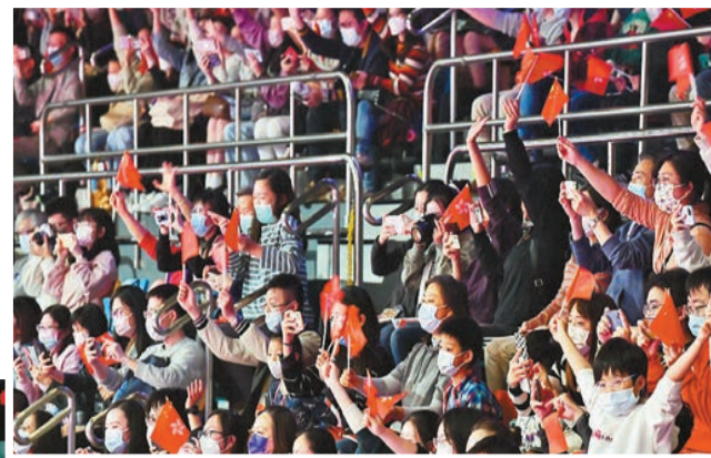
觀眾揮動國旗及區旗，氣氛熱烈。