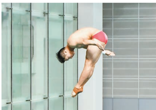
國家跳水隊隊員在維園泳池作示範表演。