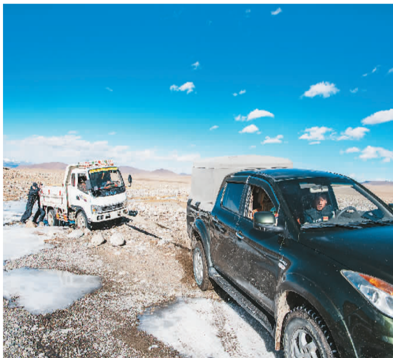
▲ 普玛江塘边境派出所的移民管理警察在巡逻途中。