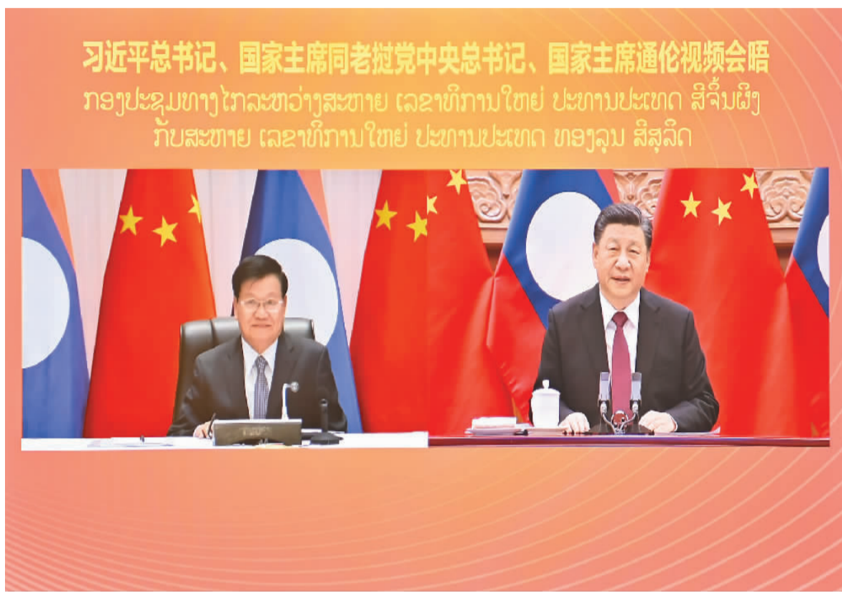
12月3日, 中共中央总书记、国家主席习近平在北京同老挝人民革命党中央总书记、国家主席通伦举行视频会晤。