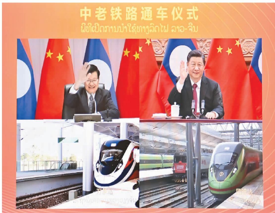
12月3日下午, 中共中央总书记、国家主席习近平在北京同老挝人民革命党中央总书记、国家主席通伦通过视频连线共同出席中老铁路通车仪式。