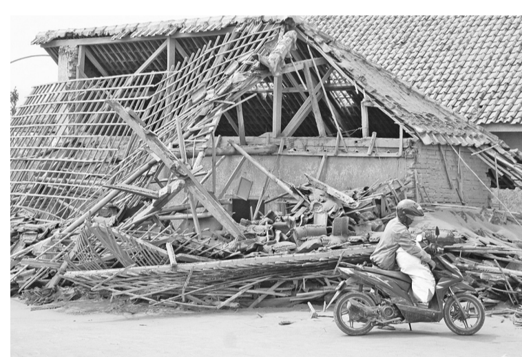
史默鲁火山喷发造成的影响 12月5日在东爪省南海漳(Lumajang)遭到史默鲁火山喷发影响,导致两镇区数十间民房损坏及8个镇区笼罩火山灰。图示一位村民正在从其住房的瓦砾中检出还能用的物品。

至于印尼铁道公司(KAI)也确定于12月5日的营运及行程仍正常。印尼铁道公司公关事务副经理尊尼(Joni Martinus)说:“现时印尼铁道公司的营运事宜仍安全及顺畅。”根据印尼铁道公司社会媒体的资料表示,往返泗水、玛琅、任抹(Jember)及外南梦(Banyuwangi)的行程都如常进行。(Ing)