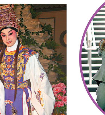
●古天樂表示今次劇本動作比以往多。

可以一直開工不用休息，因為疫情下已沒工作近一年，希望在新一年重新帶起粵劇熱潮，讓更多劇迷入場看戲。