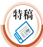
製表：香港文匯報記者 岑健樂