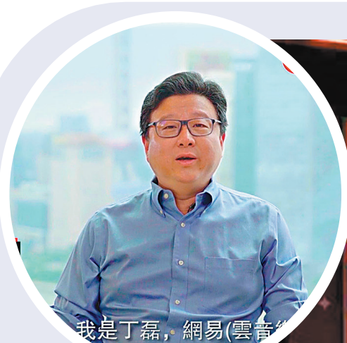
我是丁磊，網易(雲音樂) CEO Ding, CEO of Cloud Music