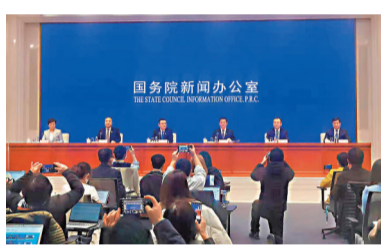
●國新辦就北京冬奧會和冬殘奧會籌辦進展舉行發布會。

香港文匯報訊(記者張帥)北京2022年冬奧會和冬殘奧會組委會3日上午在新辦辦表示，將簡化辦賽，根據疫情防控需要，精簡非必要環節、活動和人員數量，制定簡化辦賽方案，最大限度降低疫情風險，「堅持如期辦賽，確保冬奧會如期舉辦」。