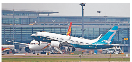
●8月11日，一架737MAX飛機在浦東機場起飛。

今年8月份，克服疫情影響，民航局組織波音公司在中國境內順利開展了737MAX8飛機審定試飛工作。在完成相關審定工作後，按照法定程序，民航局於11月11日徵求了公眾對適航指令的意見，處理公眾意見後現已完成適航批准，並於12月2日發布適航指令。