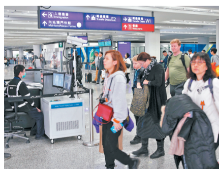
●政府建議機管局進一步收緊轉機旅客在香港國際機場逗留期間的安排。圖為香港機場禁區轉機通道。資料圖片