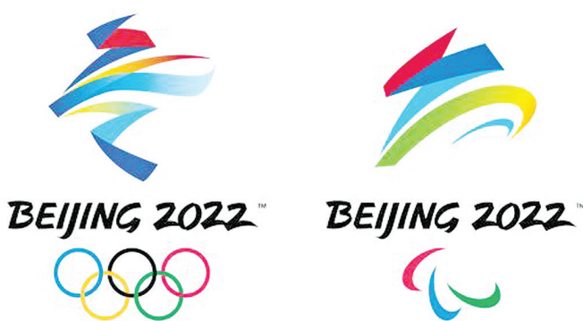
图为北京冬奥会和冬残奥会会徽。

新华社联合国电 当地时间12月2日,第76届联合国大会协商一致通过由中国和国际奥委会