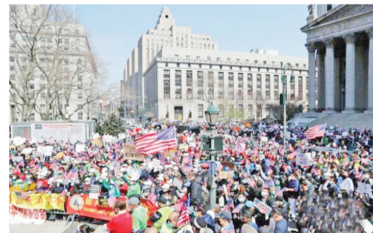
4月4日，纽约举行反仇恨亚裔大游行。

中新社北京12月3日电(记者 吴侃)美国宾州费城侨界近日组织了一场“反歧视、反暴力、反霸凌、安全城市”游行集会，数千名华裔华人聚集在费城市政厅外，手举“停止亚裔歧视”“保障公共安全”等标语牌游行至费城市教育局。同日纽约侨界也举行多场反歧视集会，声援费城的活动。