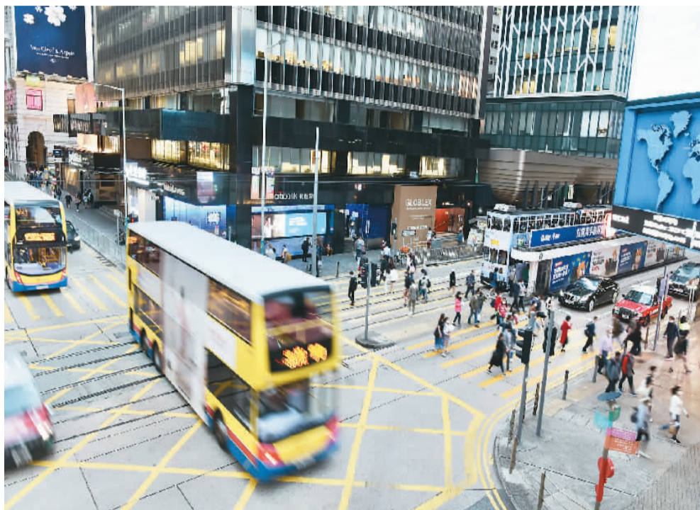
香港实质本地生产总值在今年第三季按年增长5.4%,特区政府预测全年本地生产总值增长为6.4%。图为香港中环街景。

近期香港疫情基本受控,市民增加外出消费,电子消费券的发放进一步提振了零售及餐饮业市场气氛。欧锡熊表示,第三季度香港消费及投资需求继续稳步复苏。私人消费开支录得7.1%的大幅按年实质增长。由于营商环境改善及物业交投量较一年前明显上升,整体投资开支按年实质增长10.8%。“只要香港疫情继续受控,香港经济在第四季应可实现稳健的按年增长。”欧锡熊说。