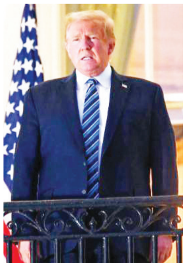
资料图：美国前总统特朗普。

据塔斯社报道，俄罗斯副外长里亚布科夫日前表示，普京和拜登的峰会准备工作已进入“高级阶段”，但会谈很可能会以视频形式进行。拜登政府拒绝提供更多细节。