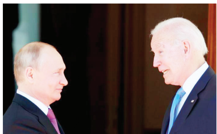
当地时间6月16日，俄罗斯总统普京和美国总统拜登在瑞士日内瓦一处名叫拉格兰奇的别墅会晤。

俄准备入侵乌克兰? 美国务卿对俄放狠话 俄“报复”美方的外交措施传出之际，外界越来越担忧“俄罗斯可能准备入侵乌克兰”。白宫发言人普萨基称，美国政府仍然“深切关注”有关俄罗斯在乌克兰边境集结军事力量的说法。