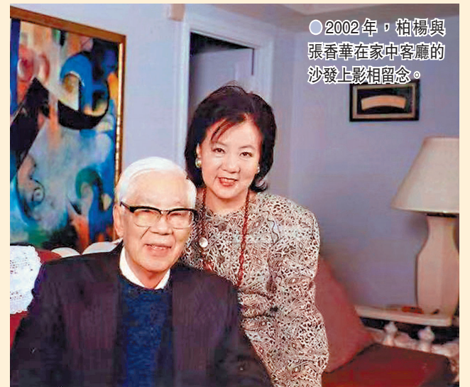
● 2002年，柏楊與張香華在家中客廳的沙發上影相留念。