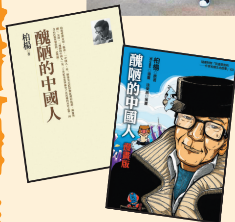
● 由台灣遠流出版社出版的《醜陋的中國人》紀念版及漫畫版。網上圖片