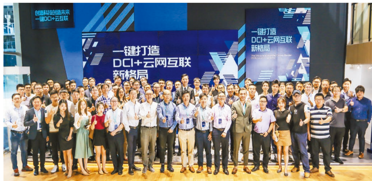
華科雲動力科技集團於深圳騰訊基地舉辦「一鍵打造DCI+雲網互聯新格局」的交流活動。