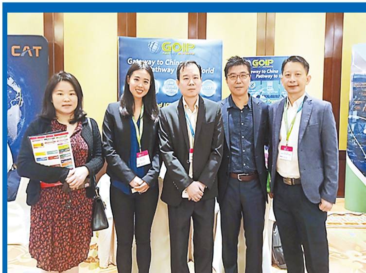
GOIP在東南亞推出一站式ICT服務、快速雲端連接和中國內地與全球之間的SD-Wan連接解決方案。