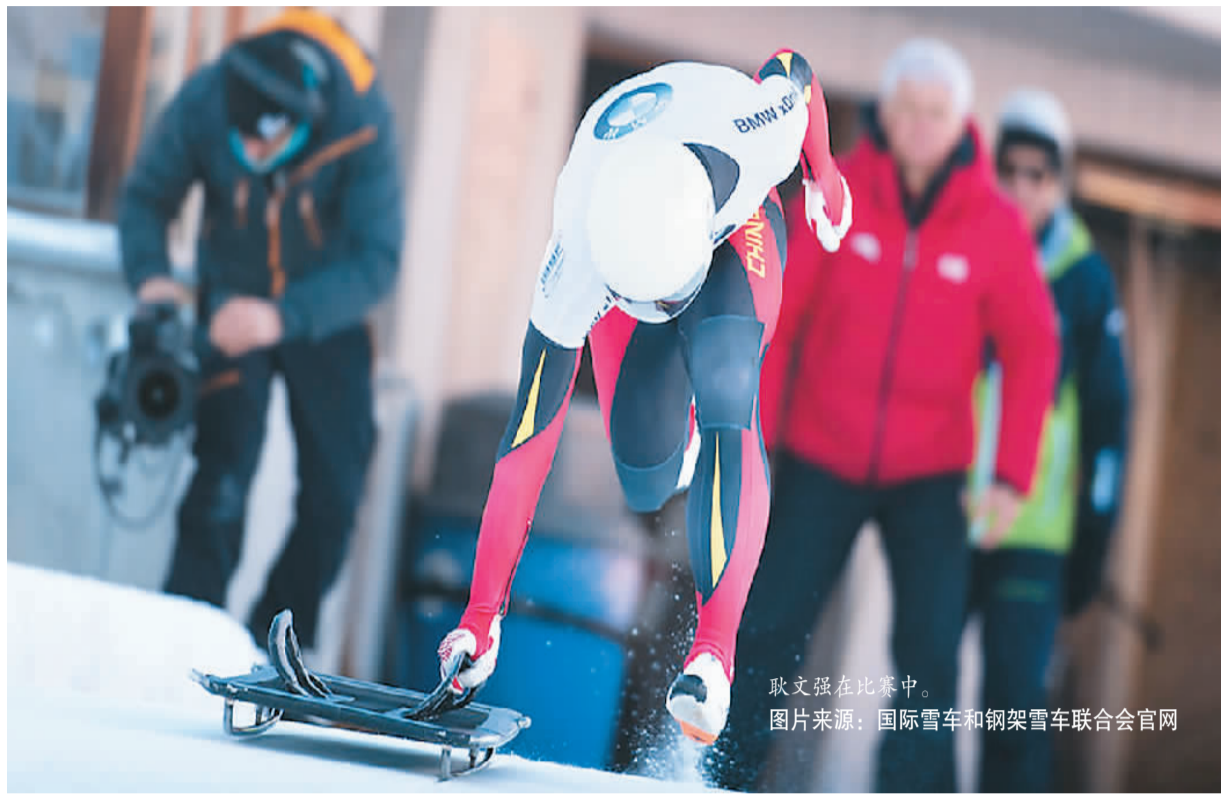
耿文强在比赛中。

近日,在钢架雪车世界杯奥地利因斯布鲁克站比赛中,中国选手耿文强以1分46秒04的成绩与英国和德国选手并列第一,获得男子钢架雪车项目冠军。这是中国钢架雪车在该项目上的首个世界杯冠军,创造了历史。 从2015年正式组队,到2018年首次亮相冬奥会赛场,再到如今站上世界杯最高领奖台——中国钢架雪车从无到有、由弱到强的经历,展现了冰雪运动发展的“中国速度”。