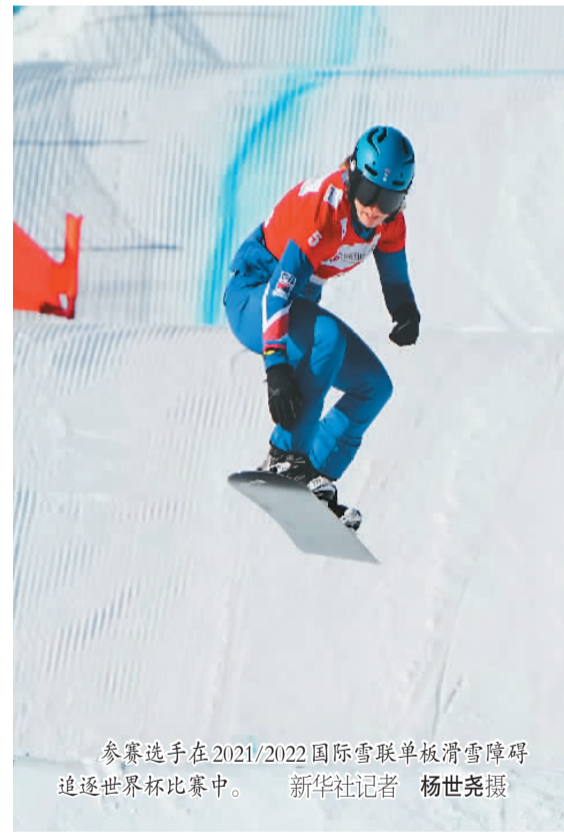
参赛选手在2021/2022国际雪联单板滑雪障碍追逐世界杯比赛中。