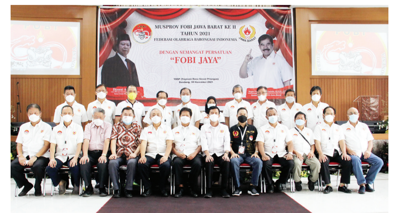
理监事与辅导合影