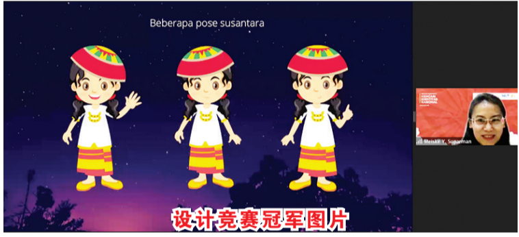
设计竞赛冠军图片