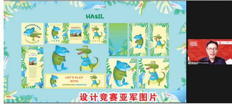
设计竞赛亚军图片