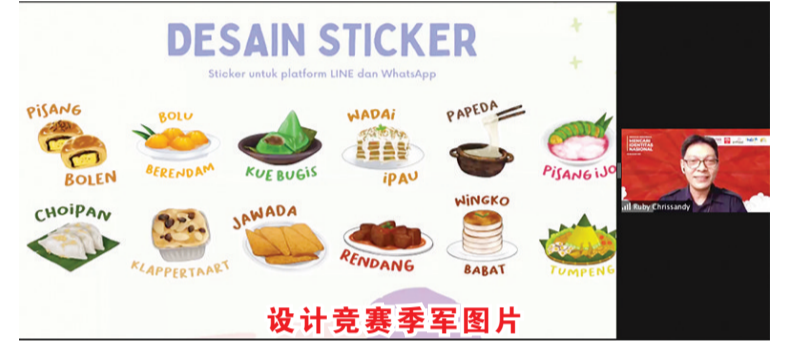
设计竞赛季军图片