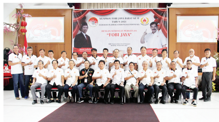
西瓜龙狮会卸任理事与总会及体育协会领导合影