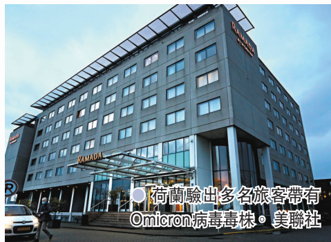
荷蘭驗出多名旅客帶有 Omicron 病毒毒株。美聯社

荷蘭衛生部 28 日宣布，在上周五從南非抵達阿姆斯特丹的兩班客機中，共有 61 名乘客確診新冠，當中至少 13 宗為 Omicron 變種病毒個案。當局仍在展開基因測序工作，預計可能會有更多 Omicron 變種相關病例。