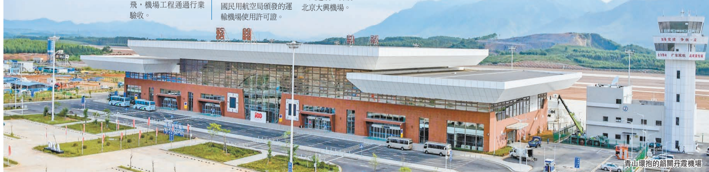
高山環抱的韶關丹霞機場