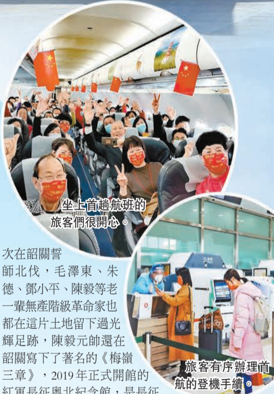
坐上首趟航班的旅客們很開心。