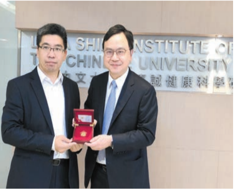
疫情影響兩地教育交流，盧煜明(右)獲得的國家教育部高等院校優秀科研成果獎一等獎等了兩年才領獎。