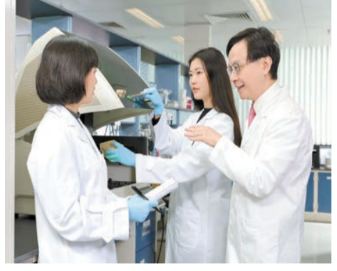
實驗室跨學科團隊將DNA測序技術應用至癌症檢測。