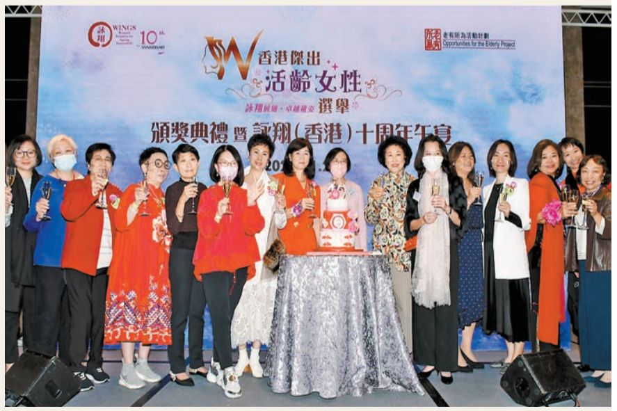
食物及衛生局局長陳肇始(右八)與各執委一同切蛋糕及祝酒。