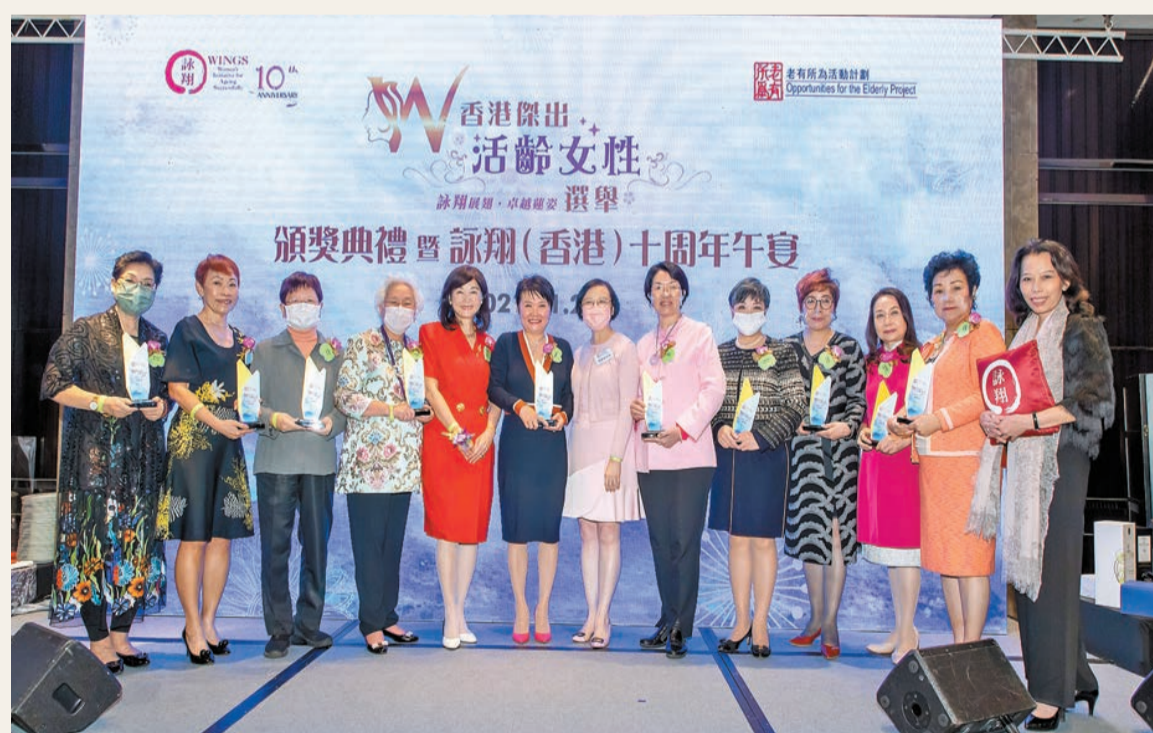
詠翔(香港)會長錢黃碧君(左五)、食物及衛生局局長陳肇始(右七)及詠翔10周年籌委會主席尹美玉(右一)與10位「香港傑出活齡女性」選舉得獎者一同合照。

除了「香港傑出活齡女性」選舉頒獎典禮外，詠翔(香港)10周年午宴亦有舉行慈善義賣活動，當中30%收益將捐贈詠翔(香港)作慈善用途，繼續幫助更多活齡女性實現豐盛人生。