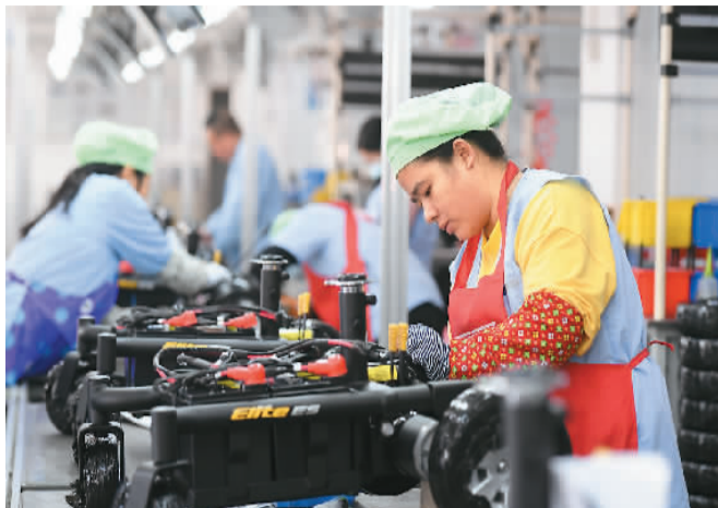
近年来，江西省丰城市积极引导企业加大科技创新、优化生产工艺，不断提高产能和产品竞争力，发展形势持续向好。图为近日当地一企业员工在赶制出口欧美国家的电动轮椅等产品。

日前，商务部印发《“十四五”对外贸易高质量发展规划》，总结了“十三五”时期外贸取得的显著成就，明确了“十四五”期间对外贸易发展指导思想、主要目标和工作重点，并给出了详细的“施工图”。商务部相关负责人表示，“十四五”时期是推进对外贸易高质量发展的关键时期。相关部门将做好任务分工，制定配套措施，确保各项工作落到实处，切实推动“十四五”时期外贸高质量发展。