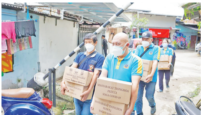
准备献上爱心礼包