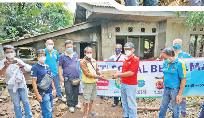
团队分发救灾爱心礼包