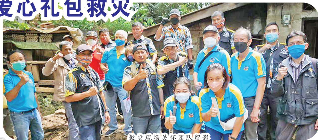
救灾现场关怀团队留影