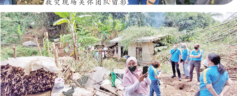
团队成员视察灾区