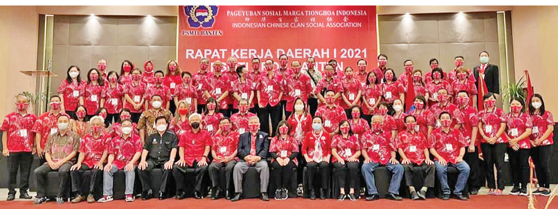
参加区域工作会议全体成员建嘉宾合影