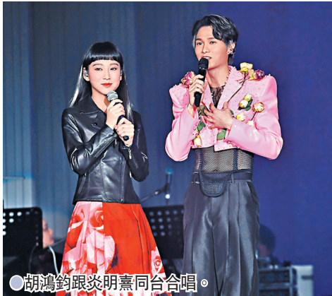
●胡鴻鈞跟炎明熹同台演唱。

在唱至演唱會主題曲《謝謝你的應援》時，Hubert終於忍不住留下眼淚，最後在歌迷的鼓勵下唱完這首歌，再加上encore部分，為現場所有歌迷帶來了一個難忘的晚上。