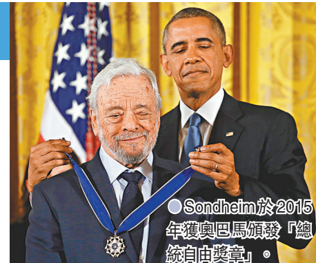
●Sondheim於2015年獲奧巴馬頒發「總統自由獎章」。

女星芭芭拉史翠珊（Barbra Streisand）推文寫道：「感謝上天讓Sondheim活到91歲，讓他有時間譜出如此動人的音樂和絕佳的歌詞！」