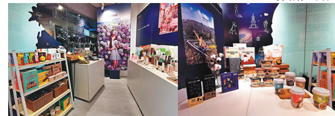
● 韓國特色產品銷售區，產品由韓國直送來港。