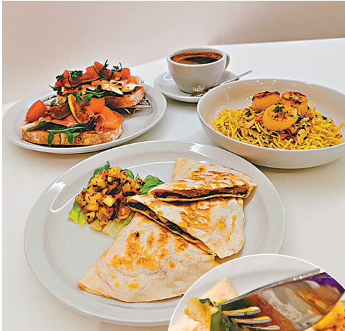
● 新店特設套餐選擇。

在咖啡方面，自家烘焙的No.18咖啡豆向來都是皇牌之一，為慶祝新店開幕，No.18咖啡膠囊以新面貌登場，餐廳特意研發以No.18濃縮咖啡為基調的「No.18咖啡奶凍」，讓大家可以充滿濃厚黑朱古力及堅果香氣的甜品歡度午後時光。還有，餐廳特製墨西哥素食餡餅，以OmniPork新豬肉為主食，配以菠蘿莎莎醬，充滿墨西哥風情的素食之選。