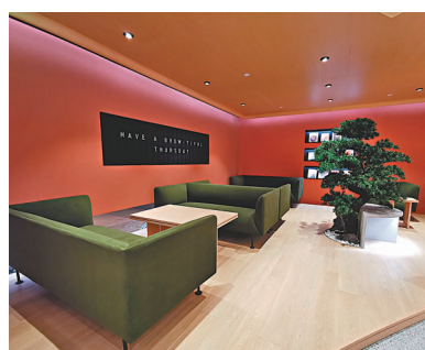
● NOC Lounge設計如「貴賓候機室」