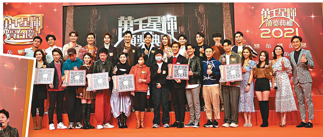
《萬千星輝頒獎典禮2021》公布提名名單記者會25日舉行。