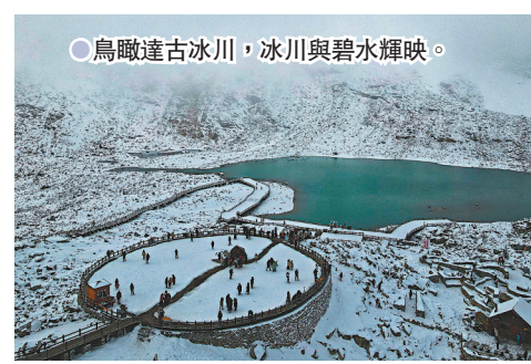
●鳥瞰達古冰川，冰川與碧水輝映。

海拔4,860米高的達古冰川是去羊茸哈德村的遊客必打卡景點，當我從海拔2,500米的山腳下乘坐纜車15分鐘即到達冰川面前，不僅感受到海拔高度轉換帶來的暈眩，更眼見一秒入冬的奇景變幻。 至於位於四川阿壩藏族羌族自治州黑水縣境內的達古冰川，則是罕見的現代山地冰川，也是目前全球海拔最低、面積最大、年紀最輕的冰川。站在高山之巔，放眼遠眺，皚皚雪山在支天霧海之上連綿起伏，甚為壯觀，讓人豪氣頓生。在陽光照射下，達古冰川與碧水相映輝映，耀人眼目，動人心魄。