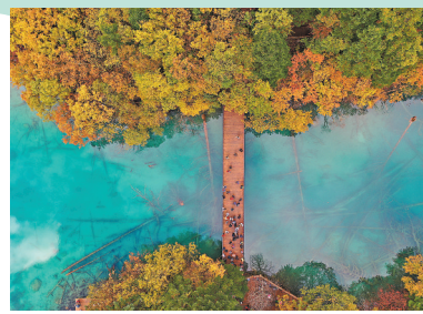
●從高空俯瞰，清晰看到湖底的鈣華、水藻、枯木。

當地人告訴我，這片碳酸鹽岩眾多的山地，流水將岩石中鈣質溶解，不斷在沿途沉積，形成鈣華，鈣華層層堆疊猶如梯田。我放眼望去，黃龍，這個由三千多個鈣華池組成，彷彿一條金色「巨龍」在蒼莽森林中奔騰。我們到來前的這場大雪，讓森林披上白衣，黃龍五彩池彷彿玉盤上的閃耀五彩光芒的琉璃，倒映着天空森林的繽紛色彩，幻化出另一個絢爛世界。