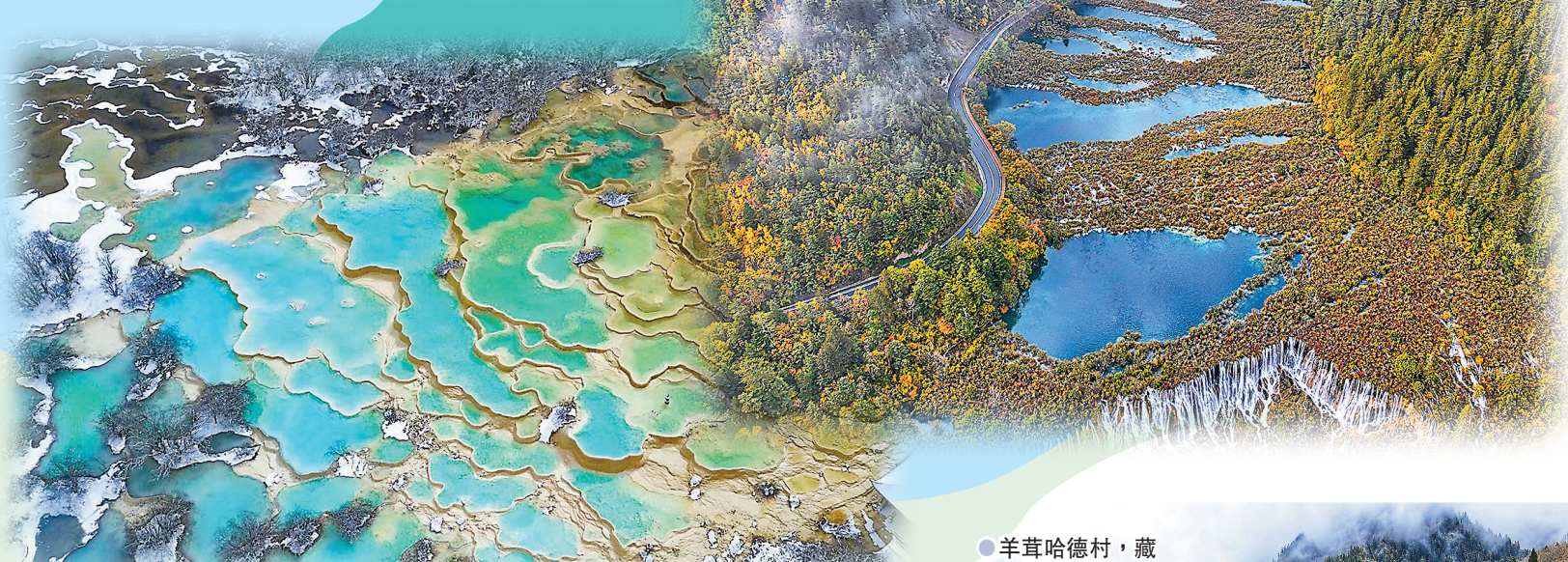
●秋季的九寨溝，滿山的彩林與碧藍的海子交相輝映，宛如色彩繽紛的童話世界。

在中國的西南部、有這樣一處土地——秘境阿壩，是山的世界、水的王國。這裏是青藏高原和四川盆地的過渡帶，板塊的力量撞擊出一道褶痕，群山之間掩映着無數聞名遐邇的人間聖地，九寨溝、黃龍、若爾蓋，一個賽一個聲名遠播。你永遠不會知道一個隨性的轉身也會墜落在自然的深淵裏，四周古樹聳立環繞，峽谷幽然縱深，飛瀑迸流，疊疊高山，海子密布，曲轉溪流。這片坐落在青藏高原和四川盆地梯級過渡帶上的神奇土地，就是四川省阿壩藏族羌族自治州。