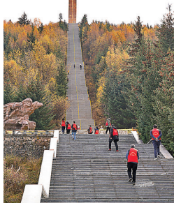
●在阿壩州松潘縣，紅軍長征紀念碑總碑高聳在山頂。

走出深山峽谷，我們一行驅車200多公里，眼前景色已然變幻成廣袤無垠的草原濕地。我們來到阿壩紅原縣，紅原意為「紅軍長征走過的草原」，而這裏也是江河之源，黃河和長江在這裏涵養並分水。草原四周群山環抱，蔓延至天際，讓人分不清到底是山的圍城還是草的邊界。 黃河從青藏高原款款流淌而來，在這裏拐了一個彎。我們在「月亮灣」看到，這條黃河上游支流「白河」，蜿蜒九曲，在一望無際的草原上千轉百回，劃出一道道舒緩優美的弧線，恰似一輪輪新月。