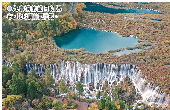
●九寨溝的諾日朗瀑布，比地震前更壯觀。

在諾日朗瀑布前，幾百米寬水流傾斜而下，水聲隆隆，比地震前更加壯觀。走在九寨溝裏，幾乎隨處可見水順着熔岩的縫隙流淌，化身美麗的河流在林間穿梭，在溝谷中累積成大大小小的海子。秋季層林盡染，湖底的鈣華、水藻、枯木，與藍天、白雲、彩林映襯，究竟是水中長滿了五顏六色的植物，還是陸地上布滿了碧玉湖泊，已然無法分辨。