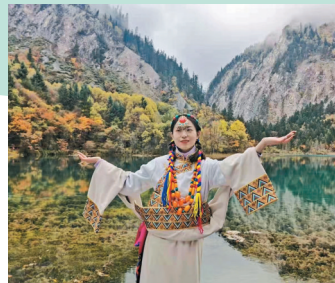
●九寨溝彩林和海子交相輝映。