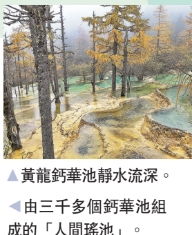
▲黃龍鈣華池靜水流深。 ▲由三千多個鈣華池組成的「人間瑤池」。