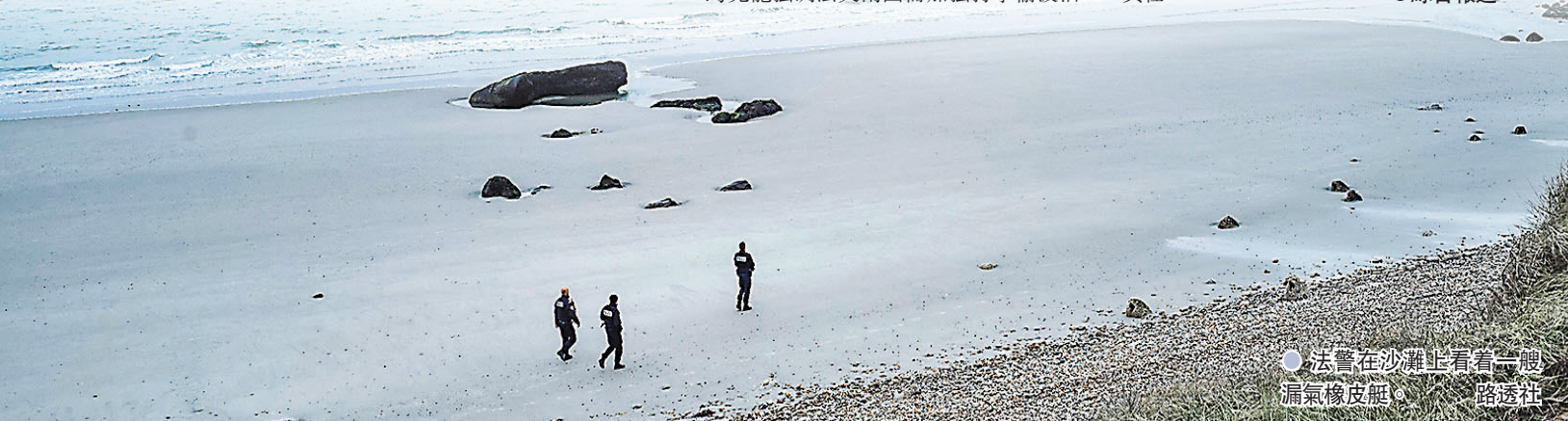
● 法警在沙灘上查看一艘漏氣橡皮艇。