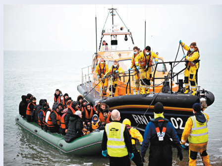
● 非法移民改經水路偷渡。