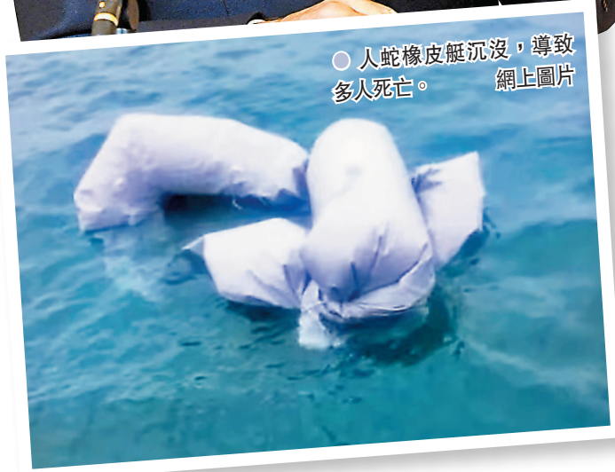
● 人蛇橡皮艇沉沒，導致多人死亡。網上圖片