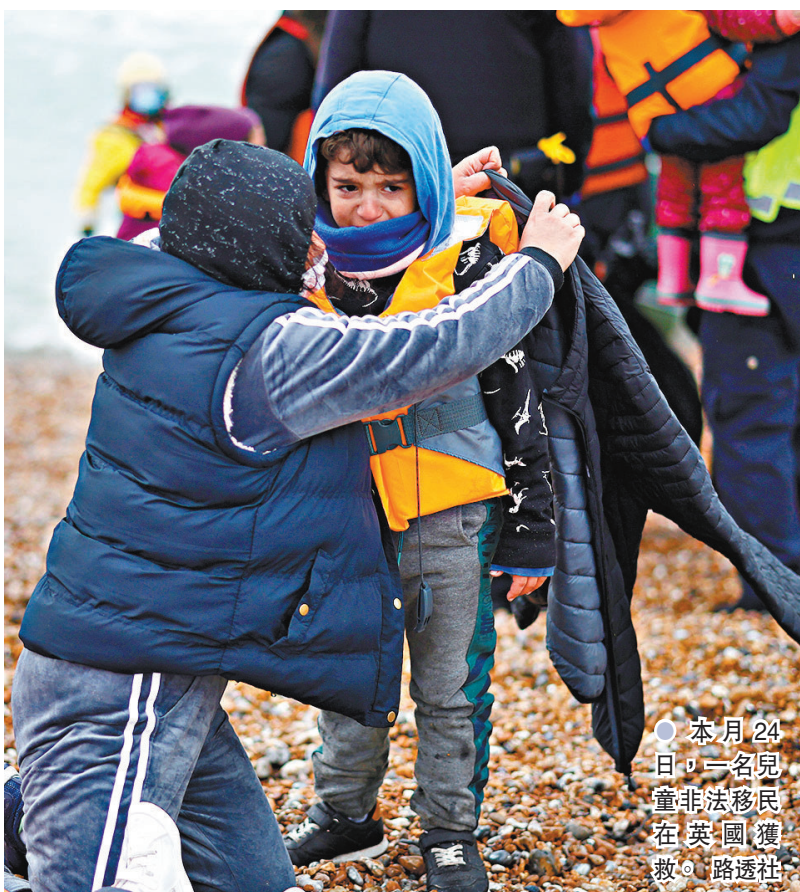
● 本月 24 日，一名兒童非法移民在英國獲救。