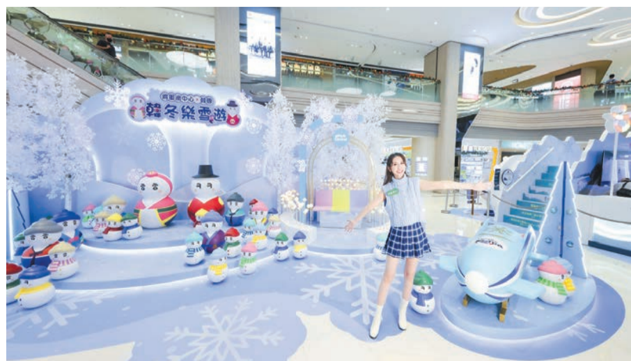
將軍澳中心聯乘韓國觀光公社合辦「韓冬樂雪遊」。

想過白色聖誕，卻又未有得飛？今個冬天，荃灣千色匯及元朗千色匯率先為大家將歐洲的浪漫雪景帶到香港。商場特意邀請著名俄羅斯紙雕藝術家Marina Adamova即日起於2022年1月2日展開其在香港首展——「聖誕「紙」想遊世界」，展出別出心裁的聖誕球，更首次以城市為創作主題，全新設計及製作了世界各地多個經典旅遊景點，蘊藏於30個小小水晶球之中，Marina的作品曾於世界各地巡迴展出。商場打造唯美的3大雪景打卡位，其中萬勿錯過18倍高的巨型紙雕聖誕球，走入紙雕中彷彿瞬間轉移到期待已久的雪地上！