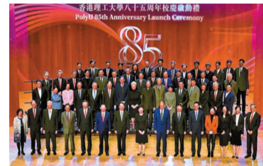
理大昨日舉行85周年校慶啟禮。

滕錦光在儀式後表示，繼加入國家安全教育後，來年即2022至23學年，理大的大學核心課程框架，將新增名為「中國歷史及文化」的範疇，當中包括多個科目，學生須從中選取一科為必修科，目的是加強學生對中國歷史及文化的理解。他又指學生守法是基本要求，強調理大學生德才兼備，以德為先。而有關教材是由權威學者製作，滕錦光又稱，校方會提供足夠