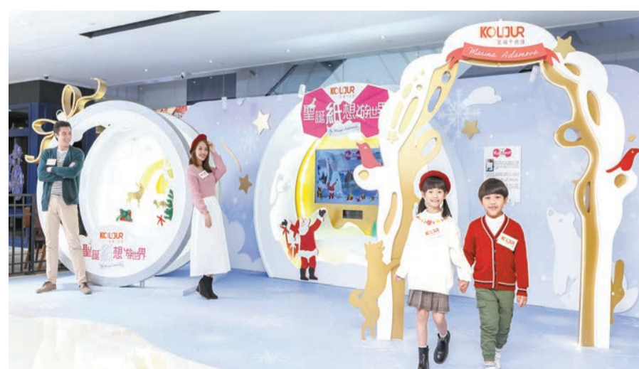
荃灣千色匯「聖誕「紙」想遊世界」。