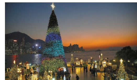
「香港繽紛冬日巡禮」今年移師西九文化區藝術公園。

旅發局總幹事程鼎一表示，聖誕小鎮今年首次於西九文化區登場，希望乘著M+博物館開幕，吸引更多市民來欣賞藝術的同時，也參觀一下歐陸聖誕小鎮，感受冬日暖意。