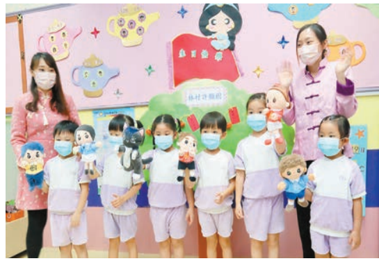
兒童從教材中認識本地節日，培養愛國情懷和學懂愛護社區。