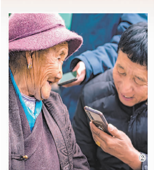
图①：广东援藏项目鲁朗小镇全景。