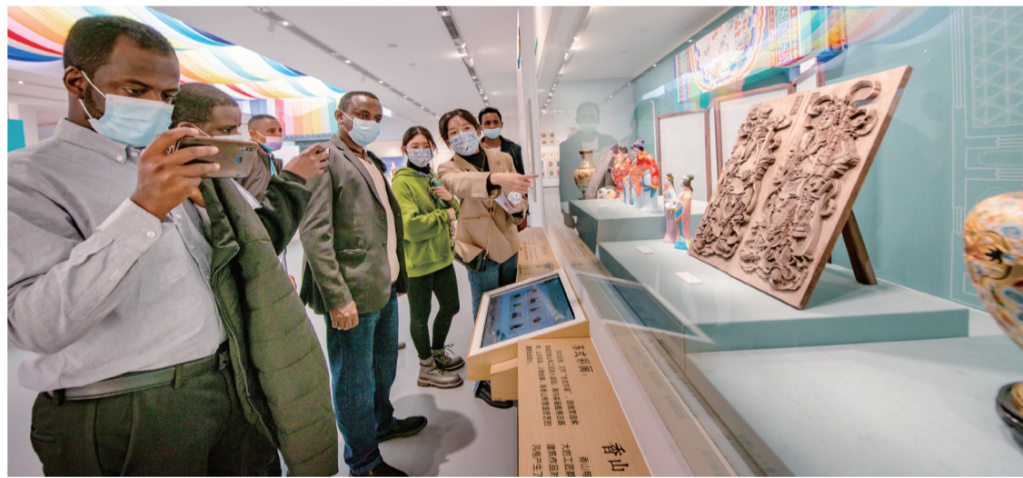
▲“感知中國”大型文化實踐課程現場

從蘆荻瑟瑟的古運河畔，到機器轟鳴的南水北調源頭泵站，再到河水浩渺的高郵湖上……日前，一場中國、蘇丹、埃及等10餘個國家近40名大學生共同參與的“感知中國”大型文化實踐課程在揚州拉