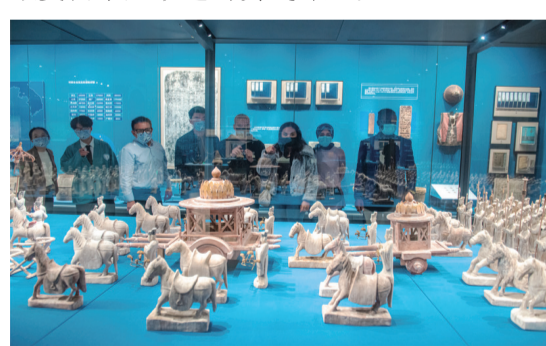
▲留學生正在認真參觀揚州中國大運河博物館

近年來，揚州大學海外教育學院充分挖掘大運河中的育人元素，以“運河爲媒”搭建文化教育國際化表達的“立交橋”，讓運河載着“中國國情課”，成爲最受留學生歡迎的實踐課堂。