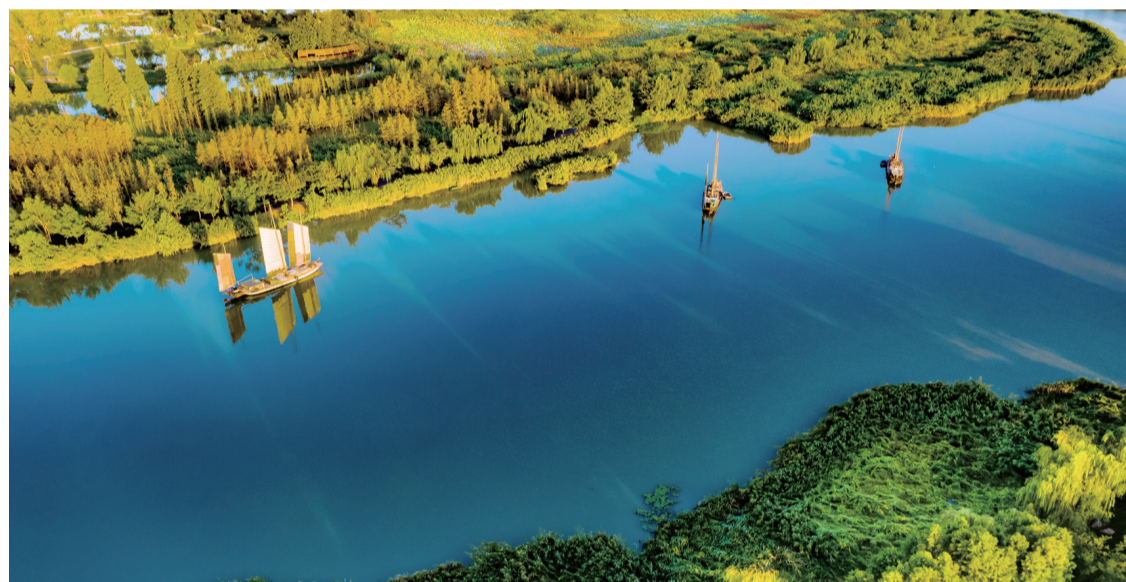
▲運河三灣生態文化公園