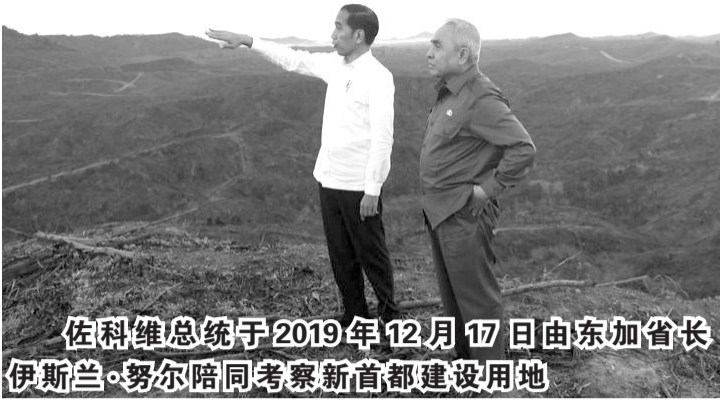
佐科维总统于2019年12月17日由东加省长伊斯兰·努尔陪同考察新首都建设用地

【本报讯】许多大型开发商有兴趣参与在东加里曼丹建造国家首都(IKN)。但直到现在,仍在等待国会国家首都迁移法规的审议通过。印尼房地产协会副