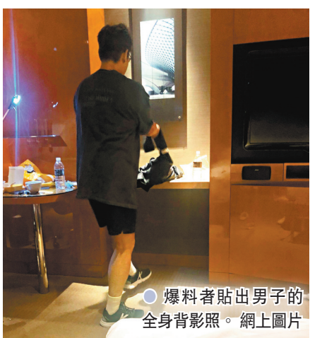
●爆料者貼出男子的全身背影照。網上圖片