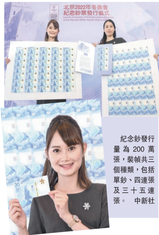
紀念鈔發行量為200萬張，裝幀共三個種類，包括單鈔、四連張及三十五連張。

【香港商報訊】中銀香港宣布發行港幣20元面值的「北京2022年冬奧會紀念鈔票」。紀念鈔將於2021年12月1日至10日(「認購申請期」)接受認購申請。紀念鈔發行量為200萬張，裝幀共三個種類，包括：單鈔157萬套，每張售價港幣138元；四連張共2萬套，每套售價港幣338元；以及三十五連張共1萬套，每套售價港幣1388元。另外，亦有200套慈善珍藏版，以競投方式發售。