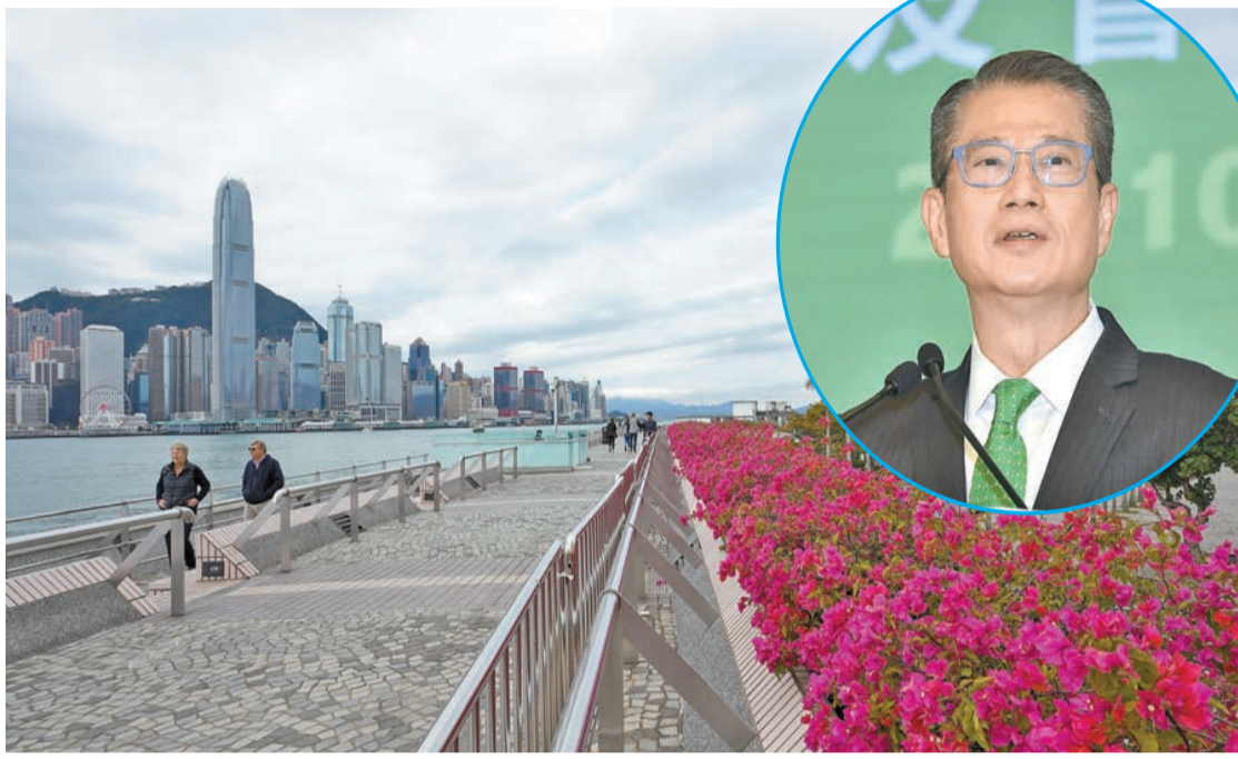
陳茂波表示，是次港府發行人民幣綠債，豐富了香港離岸人民幣金融產品種類，鞏固了香港離岸人民幣業務樞紐地位。

【香港商報訊】記者鄭偉軒報道：繼上週發行美元及歐元綠色債券後，港府昨首次發行總值50億元人民幣的3年期和5年期的離岸人民幣綠色債券，這是港府首次發行人民幣債券，為人民幣離岸市場提供重要新基準。財政司司長陳茂波表示，是次發行優化香港的債券融資平台，同時更為有效協助人民幣債券發行人進行綠色融資，以支持低碳轉型。