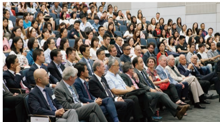
中大法律學院教學團隊來自逾20個不同司法管轄區，擁有豐富的執業或教學經驗，幫助學員建立國際化視野。

學院法學碩士、法律博士及法學專業證書課程現正接受2022-23學年入學申請。詳情請參閱學院網頁www.law.cuhk.edu.hk。