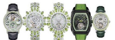
萬希泉推出「太陽寶石系列」陀飛輪腕錶。

挑選橄欖石要從色彩、色調及飽和度三個方面來評鑑，而要製作橄欖石腕錶，更要確保每顆橄欖石都顏色一致，淨度達到肉眼無瑕級別，並配合精確俐落的切割，令橄欖石更璀璨奪目。為確保每顆橄欖石都品質優異，萬希泉專誠向富麗寶石購入可溯源的天然橄欖石打造此系列腕錶。