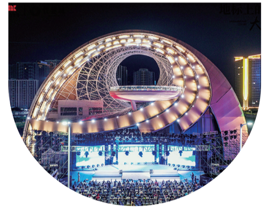
“灣區之眼”正式亮相，極具未來感的設計展現了江門這座城市的包容性。

城市地標，不僅是城市名片，更是城市精神文化的旗幟、時代發展的象徵。11月6日，江門城市新地標“灣區之眼”在濱江新區正式亮相。 “灣區之眼”位於濱江新區中鐵建總部基地商業板塊內，整體建築造型高35.7米，總寬度63米，總面積約1727.88平方米。設計造型呈弧形曲而漸變螺旋形態，建築外表面由多層雙曲面連續疊加，中心位置采用開閉鋼結構鏤空造型，外觀效果靈動而優雅。 據介紹，“灣區之眼”取意西江的卵石和南海的鸚鵡螺，采用鑲嵌融合手法，將兩個地域元素巧妙聯系，其橢圓拱形外觀宛若大門，展現了江門的包容性，與江門市“粵港澳大灣區重要節點城市”的定位相契合。 酷似眼球的建築造型，令“灣區之眼”極富未來感，以一目放眼未來，仿佛在俯瞰整個濱江新區。“灣區之眼”、江門體育中心、廣東珠西國際會展中心、園山湖公園……近幾年，一棟棟全新建築，如同雨後春筍般拔地而起，讓人們驚嘆濱江新區變化的日新月異。記者從區建管中心了解到，今年12月底，濱江新區“十路一湖”中的10條市政道路、市檔案中心將建成完工，啓動區基礎設施項目綜合管廊工程將於明年完工，一張宜居宜業宜游的活力新城圖景，正在蓬江大地徐徐展開。 (胡晴晴) (江門市宣傳部供稿)