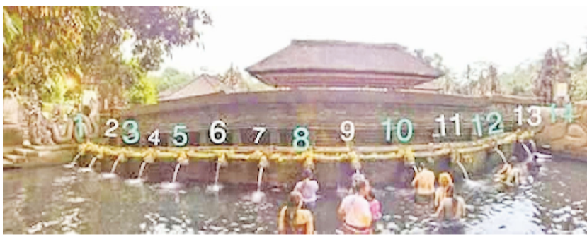
左主池的 14 个喷头