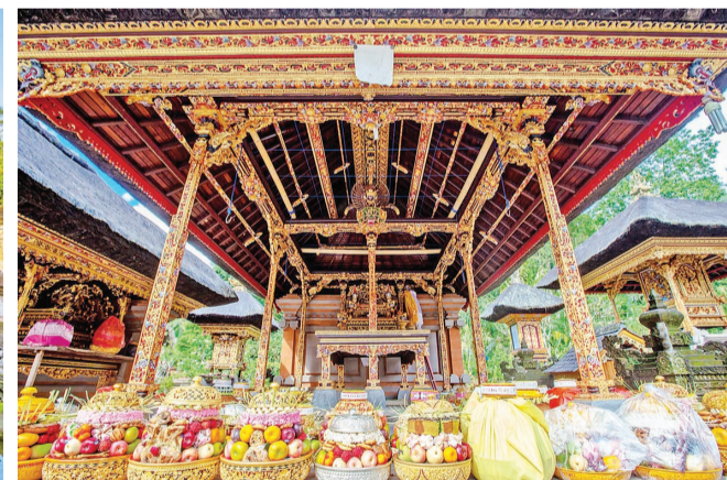
加隆安节印度教徒的敬供之物