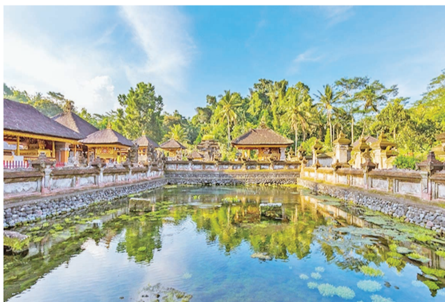
圣泉寺中的庭院鱼池