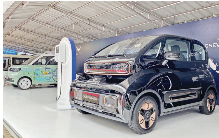
辆五菱全球小型电动车和充电器

位于巴厘岛中部的圣泉寺(Tirta Empul),此因圣泉水而闻名寺庙的建筑群一千多年来一直被巴厘印度教信徒所敬拜。其创建可追溯到公元 926 年,用来供奉印度教的水神毗湿奴,寺庙中的各个圣泉喷头据说具有精神身心的各种治疗功效。惊赞的圣洁之美至今仍吸引着来自世界各地的游客前来拜访,并全身心地沐浴于清澈的“福水”之中。