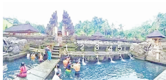
右主池的 8 个喷头

3 次,随后象征性拍打嘴唇 3 次以示“喝入圣水,身心合一”;依此类推继续移动到下一个喷头,至整个左池和右池喷头全部淋浴以示结束。然而,左池的第 11 号和第 12 号喷头仅适用于净化家中有刚过世家属的人群。