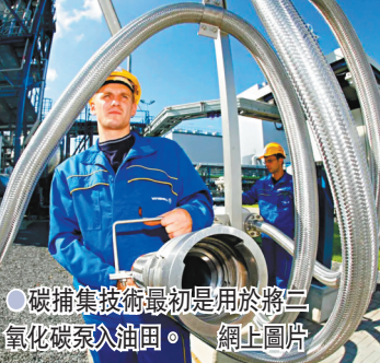
●碳捕集技術最初是用於將二氧化碳泵入油田。圖為概念圖。

碳捕集技術早在1970年代便已出現，但數十年來一直未有大规模投入應用，明顯與成本高昂、短期回報低有關，令商界缺乏動力應用，往往將二氧化碳直接排放。環境學家指出，全球步入工業化時代後，多年來累積排放大量溫室氣體，須令商界為碳排付出成本，才能促使他們採用技術，再配合植樹造林及節能減排等措施，才能有效應對全球變暖問題。