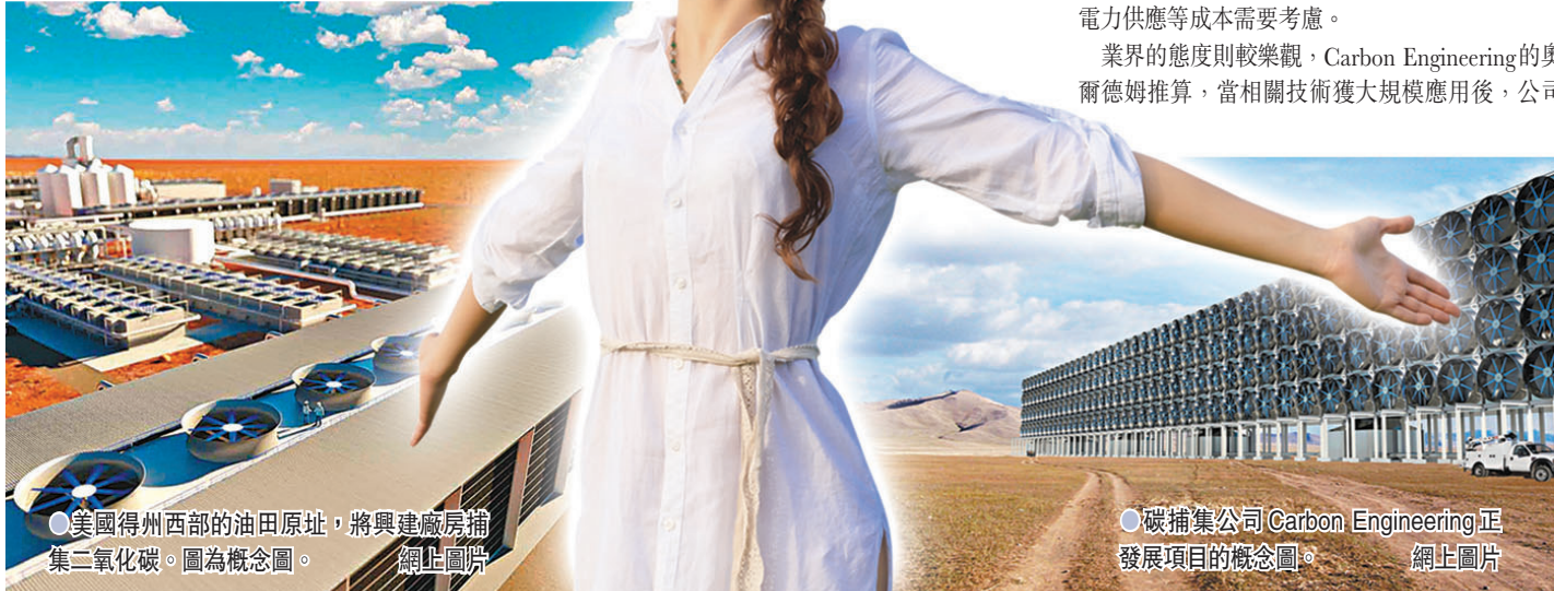
●美國得州西部的油田原址，將興建廠房捕集二氧化碳。圖為概念圖。

美國懷俄明大學的氣候學家澤利科娃則相信，社會已經有完善的成本理論，DAC和風力發電、太陽能發電等技術一樣，可隨着技術發展快速降低成本，最重要是盡量應用，並由政府支援技術商業化，擔當「第一位顧客」的角色。有批評聲音則認為，碳捕集等同鼓勵社會繼續倚賴現有高碳排放的生活方式，不過甘比爾相信這是偽命題，人類既需要減排，同時亦需要發展碳捕集。