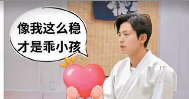
▲張哲瀚粉絲留言。網上圖片