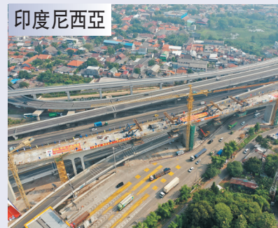
●印尼雅萬高鐵是中國高鐵首次全系統、全要素、全生產鏈在海外落地。圖為施工現場。

在東盟的11個對話夥伴當中，中國開創了多項第一。在這次紀念峰會上，習近平主席提到了其中一個：中國在東盟對話夥伴中最先加入《東南亞友好合作條約》。