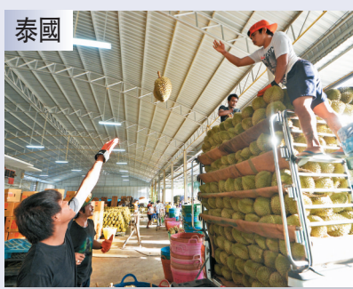
●中國目前是泰國榴蓮的最大出口市場。在泰國莊他武裏府，果農運送新採摘的榴蓮。

在峰會當天發佈的聯合聲明中，這一關係還有進一步的定義：「有意義、實質性、互利的中國-東盟全面戰略夥伴關係」。