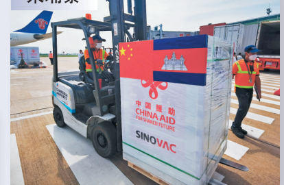
●11月17日，第七批中國援東新冠疫苗到達金邊國際機場。