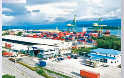
●2017年2月，中國與文萊的合資企業接手運營摩拉港。如今，摩拉港已成為東盟東部增長區在船舶靠港、裝卸作業等方面效率最高的港口。