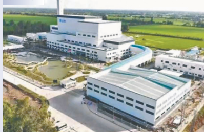
●越南芹苴垃圾焚燒發電廠由中企投資建設，是越南首座投產的現代化生活垃圾焚燒發電項目。