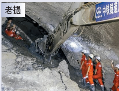
●2021年6月5日，雲南西雙版納，中老鐵路隧道全部貫通。