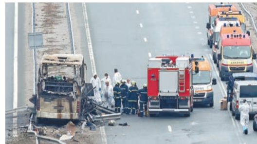
保加利亞巴士起火造成至少45人死亡。

【香港商報訊】當地時間23日3時左右，一輛掛有北馬其頓牌照的公共汽車在保加利亞西部的一條高速公路行駛期間失事起火，造成至少45人死亡。