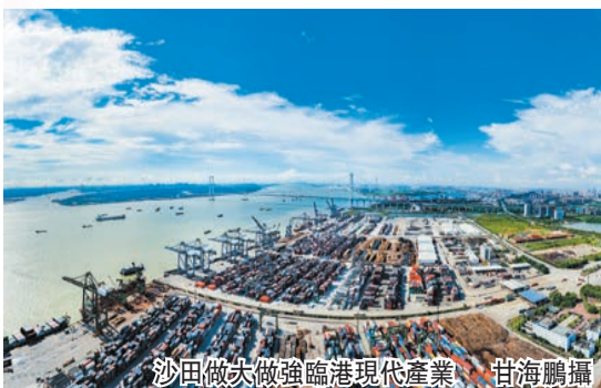
沙田做強臨港現代產業

在培育新動能方面，沙田謀劃在南部環保臨海產業集聚區推動紡織服裝、五金、橡塑製品等傳統產業轉型升級，推動存量企業提高自動化水平；同時實施「做強存量、做好增量」雙腿走路，瞄準新一代電子信息、高端裝備製造業為重點的龍頭企業，重點招引30—50億元以上產業項目，大力扶持企業上市，推進資本市場「沙田板塊」持續擴張。