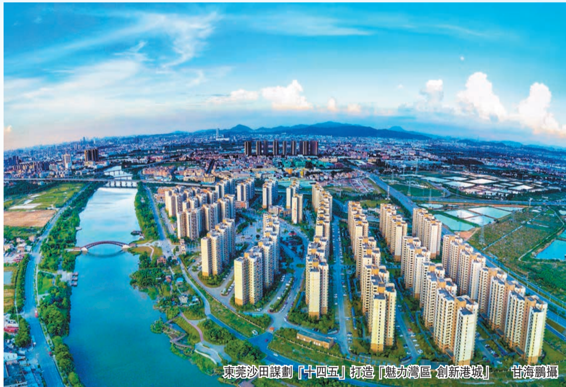
東莞沙田謀劃「十四五」打造「魅力灣區 創新港城」